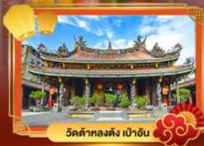
วัดต้าหลงตั้ง เป่าอัน