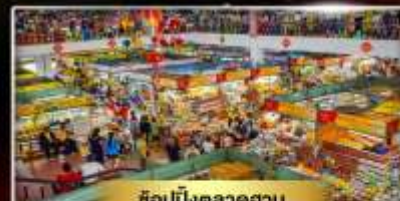
ช้อปปิ้งตลาดฮาน