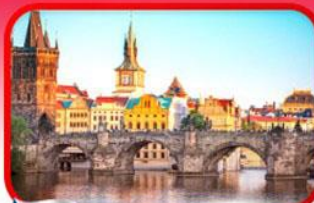
เขื่อนอินสพานชาร์ลส์