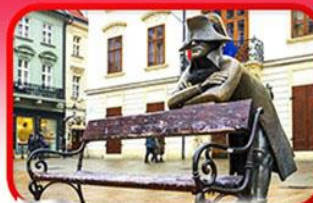
ย่านเมืองเก่าราติสลาวา

เที่ยวเมืองสวยริมทะเลสาบ ฮัลล์สตัดท์ • ชมเมืองไข่มุกแห่งโบฮีเมีย เซสกี กรุงลอน • ปราก • เวียนนา • ซอปปิงพาร์นดอร์ฟ เอาก์เล็ท