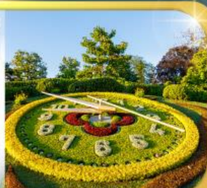
นาฬิกาดอกไม้เมืองจนีวา