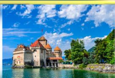
ปราสาทชิลยง