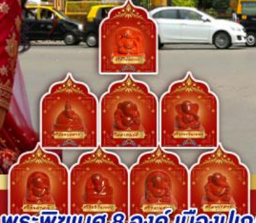
พระพิฆเนศ 8 องค์ เมืองปูणे