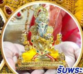
รับพระพิฆเนศ ปางรำรอย ท่านละ 1 องค์