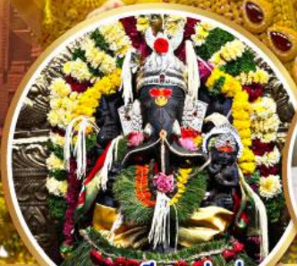
พระตรีศูล ปูणे (Trishul Pune)