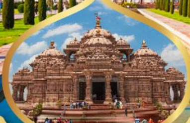
วิหารอักซาร์ดีม