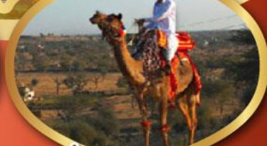
ฟรี ขี่อูฐ เมืองมันทาวา ราคาเริ่มต้น