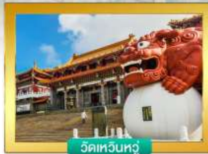
วัดเทวินหัว