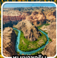
หุบเขาซาริน