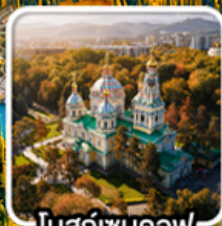
โบสถ์เซนคอฟ

นั่งกระเช้าคอนโดล่าขึ้นสู่ชิมบูลัก สตรีสออร์ก ไร่มุกแห่งเทือกเขาเทียนชาน ทะเลสาบโคลโซ หุบเขาเจดี โอกูซ / ภูเขาหินเทพนิยาย / ทะเลสาบอัสซิกกุล ชมการแสดงการล่าเหยื่อของนกอินทรี