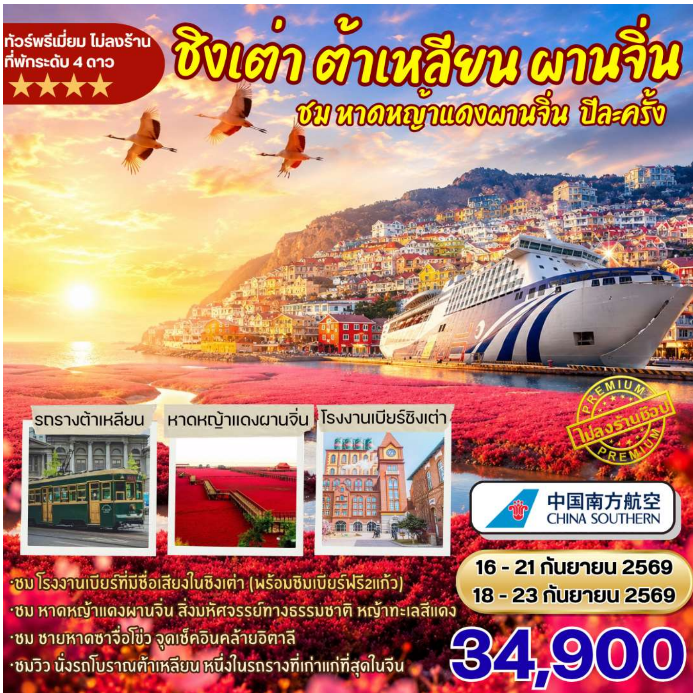
รถรางต้าเหลียน