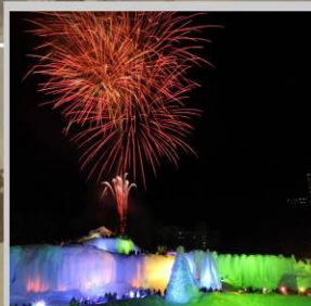
"SOUNKYO ICE FEST"