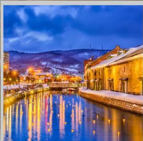
"OTARU CANAL FEST"