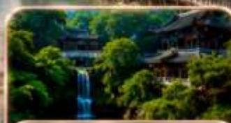
ถนนโบราณเจียฟางเป็ย