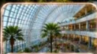
THE RING MALL CHONGQING