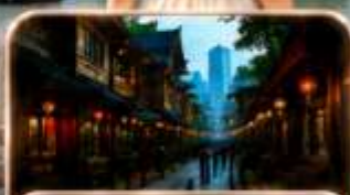
หมู่บ้านโบราณฉือซีโซ่ว