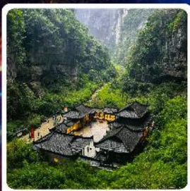
อุทยานแห่งชาติหลุมบ่อฟ้า

ไฮไลท์! อุทยานแห่งชาติหลุมบ่อฟ้า มรดกโลกระดับ 5A รถไฟฟ้าทะลุтик ตึกตะกียบ อลังการการแสดงสียงหยาดัง