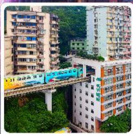
รถไฟฟ้าทะลุтик