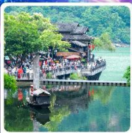
หมู่บ้านชาวน้ำเสี่ยเหรินเจีย