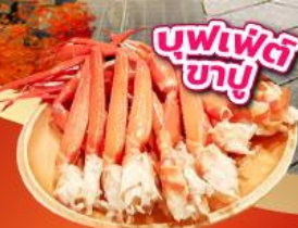
บุฟเฟ่ต์ ชาบู

เช็किनจุดถ่ายรูป ศาลเจ้าฟูจิซัง ฮงกุเซ็นเกินไทยะ