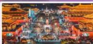
ถนนวัฒนธรรมราชวงศ์ถัง