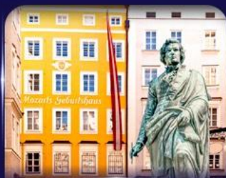
บ้านเกิดโมสาร์ท ซาลซ์บูร์ก