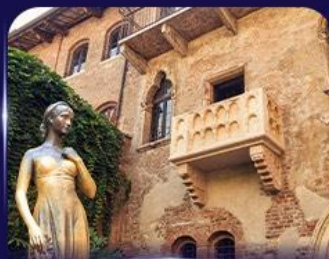
เขื่อนบ้านลูลียัต เวโรนา