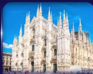
เซนต์อันวิหารดูโอโม มิลาน