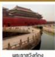
พระราชวังกรุงปักกิ่ง