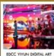
EDCC YIYUN DIGITAL ART