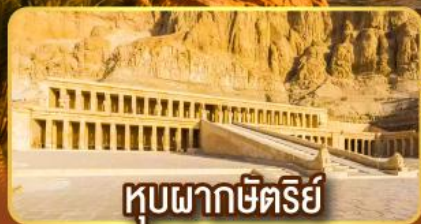
หุบผากษัตริย์