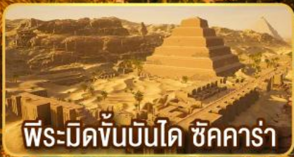
พีระมิดขั้นบันได ชัคคาร์่า