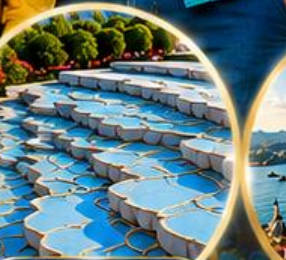
ปานุกคาล์ Pamukkale