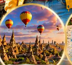
เมืองคปปาโดเกีย Cappadocia