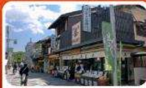
ช้อปปิ้งถนนสายชาเขียว