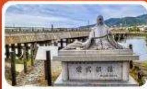
สะพานอูจิ