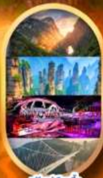
พรีเซ็นเลือกซื้อ Option เสริม