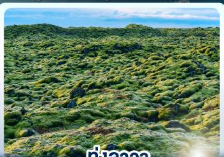
ทุ่งลาวา