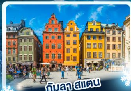
กับลาสแดน