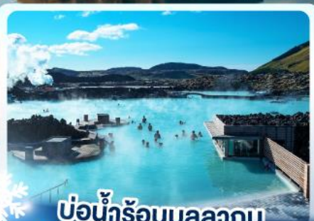
แช่น้ำร้อนบลูลากูน

เก็บไอซ์แลนด์ แดนภูเขาไฟคิรูกูเฟล และ แช่น้ำร้อนบลูลากูน