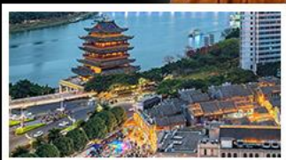
ถนนคนเดินสามตรอกสองซอย