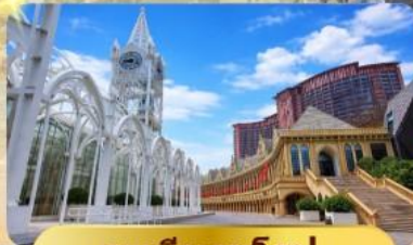
ระเบียงยุโรป