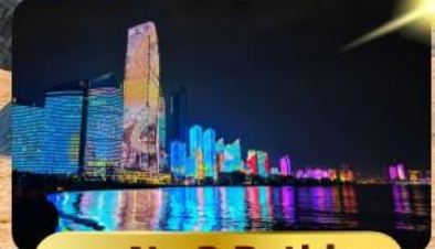
หาด No.3 Bathing

เมนูพิเศษ ซาบูสายพาน 6 วัน 4 คืน เดินทาง : พฤษภาคม 69