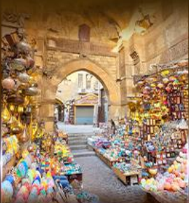
ตลาดฟานเวลกาลลี