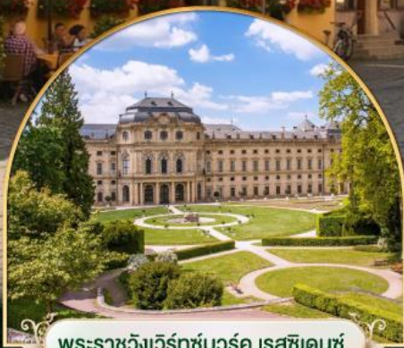
พระราชวังเวิร์ทซ์บวร์ค เรสซิเดนซ์