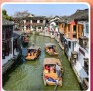
หมู่บ้านโบราณซูเจียวเจียว