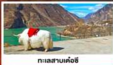
ทะเลสาบเค่อซี