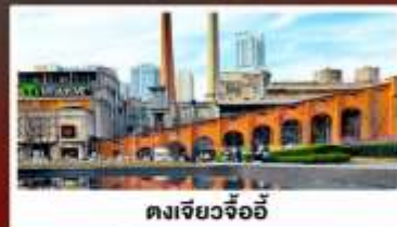
ตงเจียวจ้ออ๋