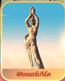
พีชเซอร์เกิร์ล