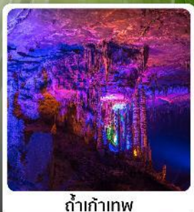
ดำเก้าทพ