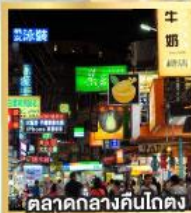
ตลาดกลางคืนโกตง