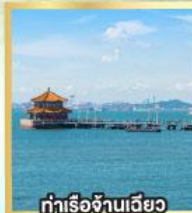
ท่าเรือจันทิว