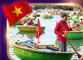
เรือกระด้ง หมู่บ้านกิมทาน