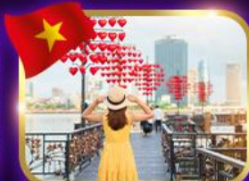
เชิควินสะพานแห่งความรัก