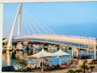
สะพานคู่รักตั้นสุ่ย