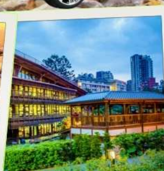
ห้องสมุดเป่ย์โถว