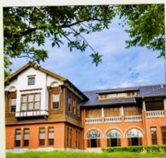
พิพิธภัณฑน์น้ำพุร้อนเป่ย์โถว