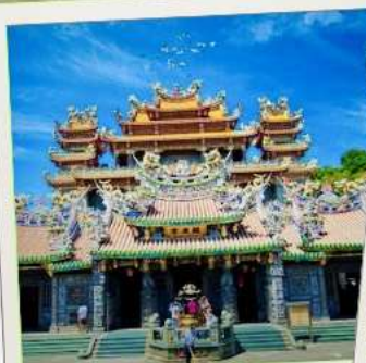
วัดกวนตุ๋