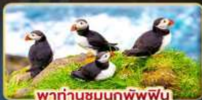
พาท่านชมนกพัฟฟิน