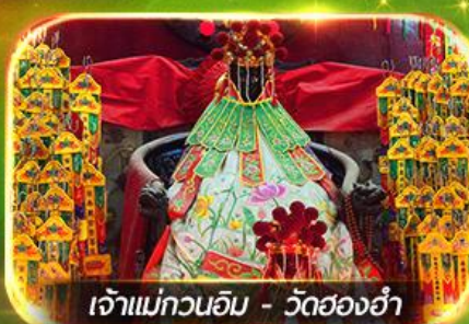
เจ้าแม่กวนอิม - วัดย่งฮำ