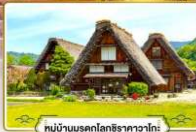
หมู่บ้านมรดกโลกชิราคาวาโกะ

✔ ช้อปบิงย่านฮิตที่สุดในโอซาก้า "ชินโซบาชิ"