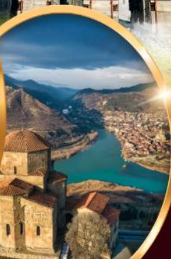
อารามจวารี