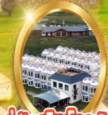
ที่พักสไตล์กระโจม