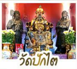
วัดปี้กั๊โต