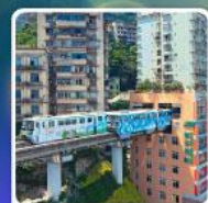
รถไฟฟ้า-ลุดัก