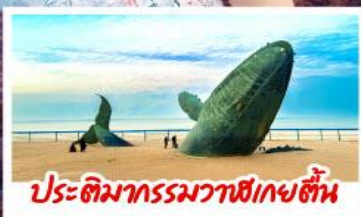
ประติมากรรมวาฬยักษ์ต้น