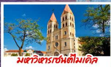
มหาวิหารเซนต์โมติล