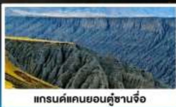
แกรนด์แคนยอนคู่ซานจื่อ