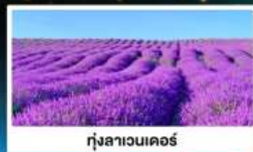
ทุ่งลาเวนเดอร์