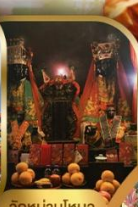
วัดบ้านใหม่