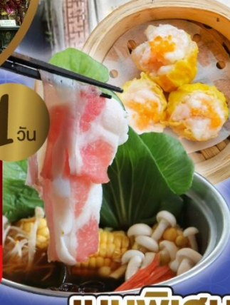
เจ้าแม่กวนอิม ริพลีสเบย์