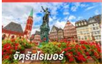
จัตุรัสโรเมอร์