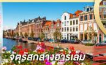
จัตุรัสสากส์ฮาร์เล็ม