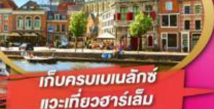
เก็บครบเบเนลักซ์ แวะเที่ยวฮาร์เล็ม