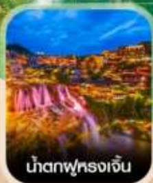
น้ำตกผุ่หลงเจิ้น

สัมผัสสายหมอกแห่งขุนเขา สะพานอ้ายจ้าย แบบพาโรนา แช่น้ำพุร้อนกลางธรรมชาติ อุทยานป่าไม้บูเออร์เหมิน ชมความอลังการ น้ำตกพันปี หมู่บ้านโบราณผุ่หลงเจิ้น