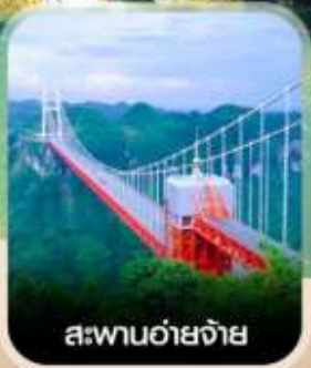
สะพานอ้ายจ้าย