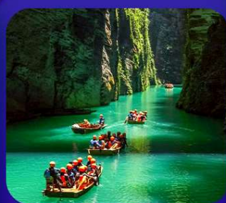
“ ผิงซานแกรนด์แคนยอน ”