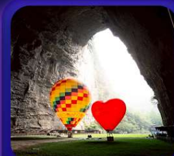
“ ถ้าถึงหลง ”

T2G-CKG29FD ลงชิง เอ็นจีโอ...ถ้าถึงหลง ล่องเรือมังกรกังสุ่ย ผิงซานแกรนด์แคนยอน 5D 4N (FD)