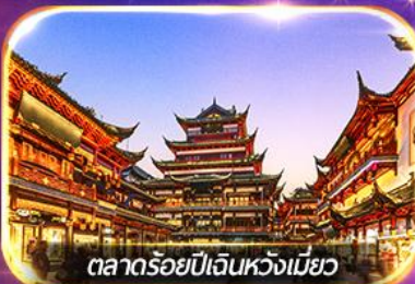
ตลาดร้อยปีเงินห้วงเหมียว