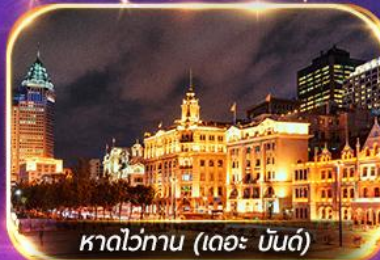
หาดว่อกาน (เดอะ บันด์)

เที่ยวดิสนีย์แลนด์เต็มวัน (รวมรถรับ-ส่ง)