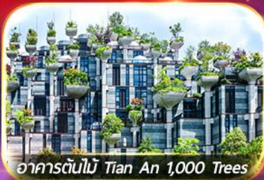
อาคารต้นไม้มิ Tian An 1,000 Trees