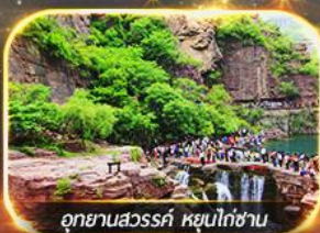
อุทยานสวรรค์ หยุนโก่ซาน