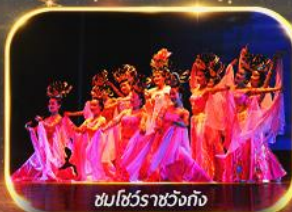
ชมโชว์ราชวงศ์ถัง

นั่งรถไฟความเร็วสูง ย้อนประวัติศาสตร์อันยิ่งใหญ่ "กองทัพทหารจีนซี" สัมผัสความงามอุทยานสวรรค์ พิเศษ!! ชมโชว์ราชวงศ์ถัง เก็บครบทุกไฮไลต์ ซอปปิงจิว ห้าง WU YUE