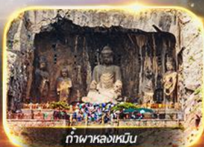
ถ้ำพาลงเหมิน