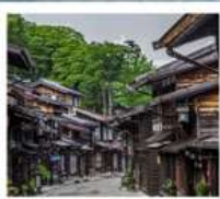
หมู่บ้านโบราณนารายิ จุกุ