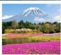
ทะเลสาบโมโตสุ ทุ่งพืชมอส