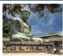
วัดโศโตคุอิน

SHIRAKAWAGO JAPAN ALPS MATSUMOTO KAMIKOCHI FUJI KAMAKURA