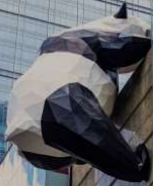
ยานไท่กุ๋พลี IFS (หมีแพนด้าปีนตึก)

เดินข้ามถนนมาอีกหน่อย ท่านจะได้ซื้อป๊อง ถนนคนเดินชุนซีอู่ (Chunxi Road) เต็มไปด้วยร้านค้าแบรนด์ชั้นนำทั้งในและต่างประเทศ รวมถึงร้านเสื้อผ้าแฟชั่น รองเท้า อุปกรณ์อิเล็กทรอนิกส์ และของฝาก ถนนคนเดินชุนซีอู่เป็นจุดที่มีความคึกคักและเต็มไปด้วยผู้คน โดยเฉพาะในช่วงวันหยุดสุดสัปดาห์และเทศกาลต่างๆ คุณจะได้พบกับการแสดงศิลปะการแสดงดนตรี และกิจกรรมที่น่าสนใจ มีร้านอาหารมากมายที่เสนาอาหารท้องถิ่นและขนมหวานที่หลากหลาย นักท่องเที่ยวสามารถลิ้มลองเมนูพื้นเมืองที่อร่อย เช่น เสี่ยวหลงเปา (ซาลาเปานึ่ง) หรือขนมโบราณตามรอยซีรีส์จีนอย่าง มาโลโกว ก็มีเช่นกัน