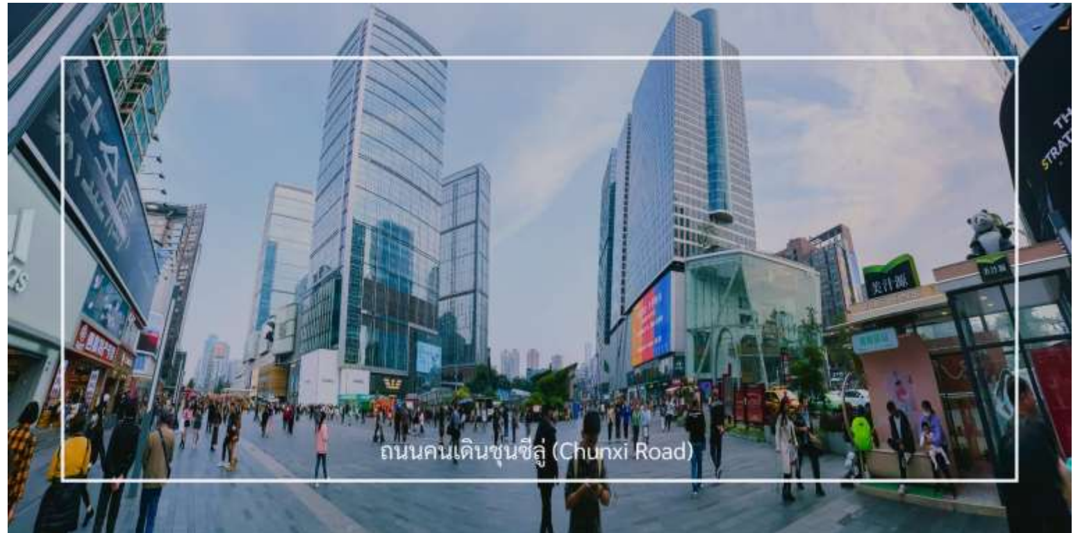
ถนนคนเดินชุนซีอู่ (Chunxi Road)

เดินข้ามถนนมาอีกหน่อย ท่านจะได้ซื้อป๊อง ถนนคนเดินชุนซีอู่ (Chunxi Road) เต็มไปด้วยร้านค้าแบรนด์ชั้นนำทั้งในและต่างประเทศ รวมถึงร้านเสื้อผ้าแฟชั่น รองเท้า อุปกรณ์อิเล็กทรอนิกส์ และของฝาก ถนนคนเดินชุนซีอู่เป็นจุดที่มีความคึกคักและเต็มไปด้วยผู้คน โดยเฉพาะในช่วงวันหยุดสุดสัปดาห์และเทศกาลต่างๆ คุณจะได้พบกับการแสดงศิลปะการแสดงดนตรี และกิจกรรมที่น่าสนใจ มีร้านอาหารมากมายที่เสนาอาหารท้องถิ่นและขนมหวานที่หลากหลาย นักท่องเที่ยวสามารถลิ้มลองเมนูพื้นเมืองที่อร่อย เช่น เสี่ยวหลงเปา (ซาลาเปานึ่ง) หรือขนมโบราณตามรอยซีรีส์จีนอย่าง มาโลโกว ก็มีเช่นกัน