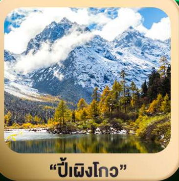
"ปี่ผิงโกว"

T2G-TFU25SL Basic Chengdu...เจิงตู สี่ครุณี ปี่ผิงโกว 4D 3N (SL)